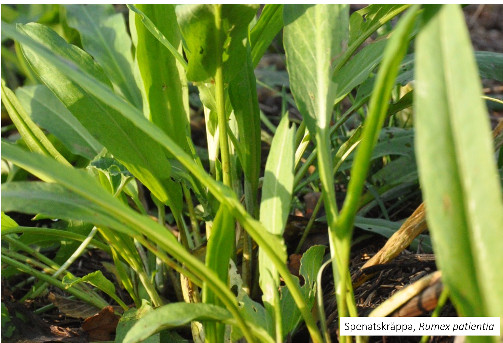
Spenatskräppa, Rumex patientia