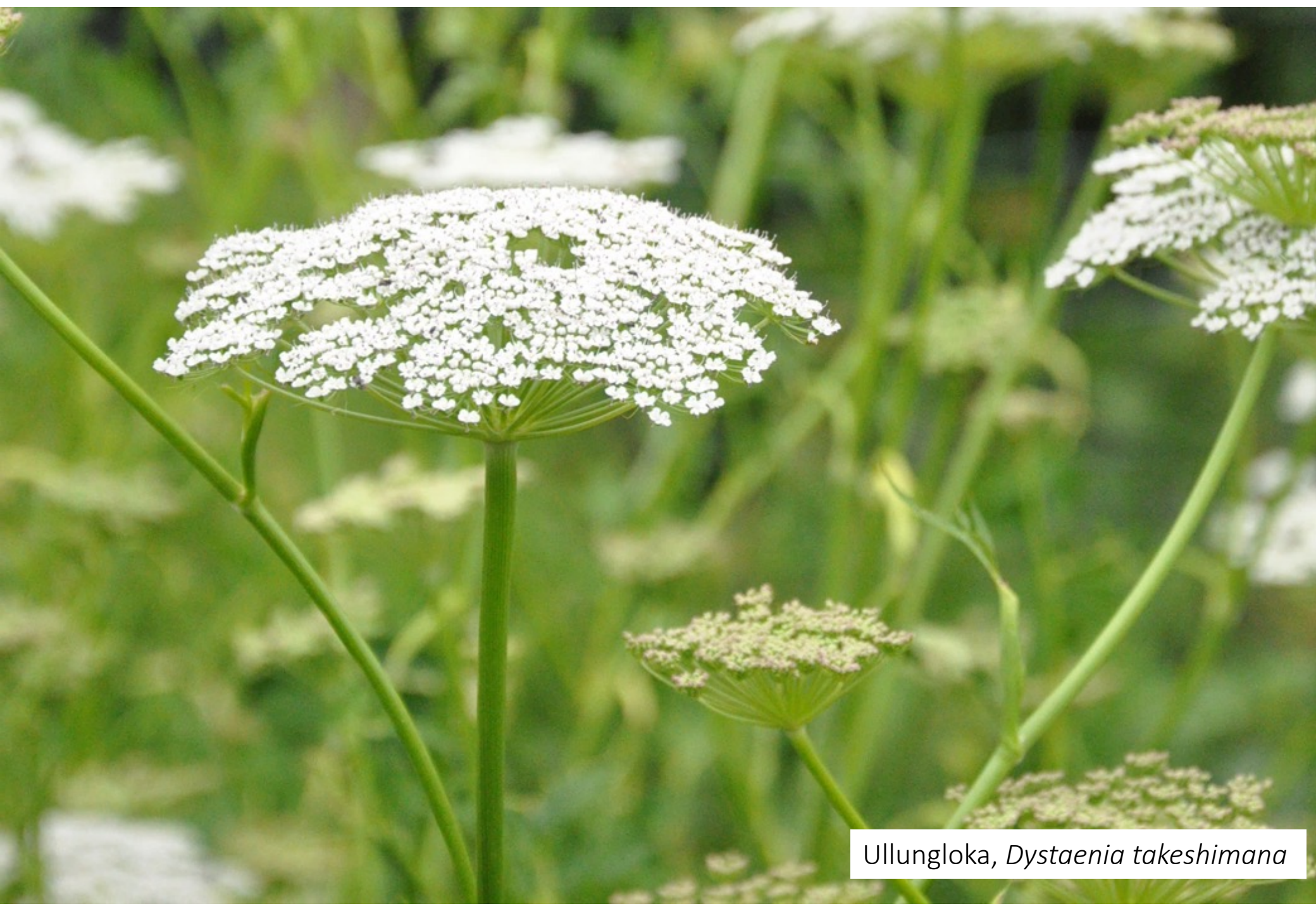
Ullungloka, Dystaenia takeshimana